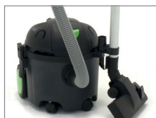
KLEM VOOR ZUIGSTANGEN