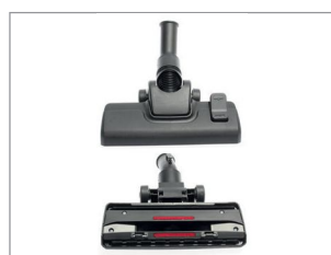
STERKE COMBI ZUIGMOND VOOR EFFICIËNTE WERKING EN EEN PERFECT